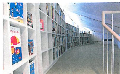
読み聞かせスペース（2階）

※絵本閲覧スペースから階段で上がったところにも、読書（読み聞かせ）スペースがあります。